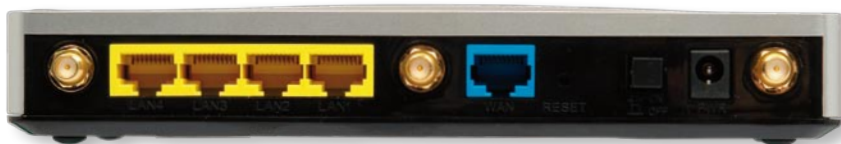
2dBi antény lze odšroubovat a případně vyměnit za silnější 3dBi

3,2 W. AirLive tak jednoznačně patří mezi nejušpornější dual-bandový router na trhu. Pokud vezmete v úvahu i jeho přijatelnou cenu vzhledem k 1Gb/s portům a 3T3R 5GHz rozhraní, stojí tento model za koupi. Náročnější uživatelé se však musí smířit s několika ústupky. ◀